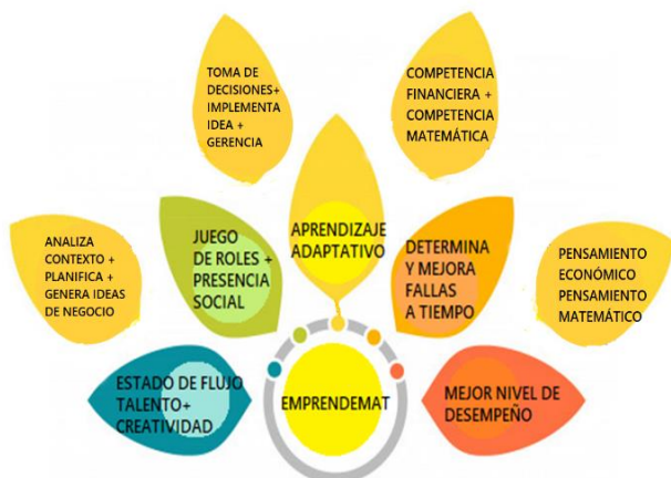
Figura 2. Estrategia pedagógica EMPRENDEMAT. Fuente: Elaboración propia.

El análisis de satisfacción (Figura 2), permite observar que la estrategia EMPRENDEMAT potencia el aprendizaje adaptativo, mejora la determinación de fallas y asesoría por parte del docente, mejora las calificaciones de los jóvenes en matemáticas y matemática financiera, su método incluye juego de roles lo que motiva a los jóvenes a desarrollar estrategias de negocio y evaluar los resultados de sus negociaciones, mejora la concentración, despierta interés, creatividad y su curiosidad.