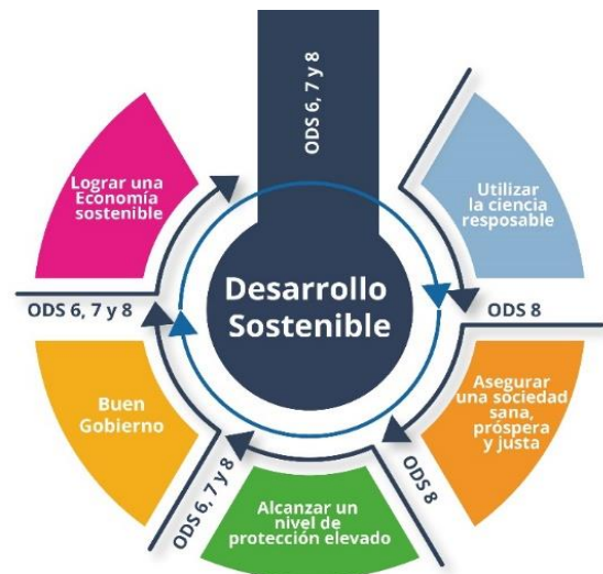
Figura 3. Interrelación de las cinco circunstancias para alcanzar el desarrollo sostenible con los objetivos del desarrollo sostenible

[25], valores agregados que sin lugar a dudas coadyuvan a la visibilización y posicionamiento en los mercados.