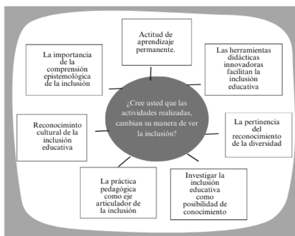
Figura 2: Acciones para mejorar la inclusión educativa.

En consecuencia, se presenta en la figura 2, las categorías axiales que estructuran los principales componentes de orden pedagógico y didáctico subyacente a una necesaria práctica pedagógica innovadora e incluyente.