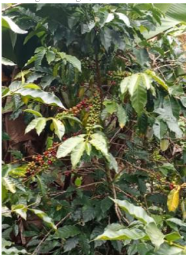
Fig. 1: Café castillo de la finca el crisol y el vergel.

Leche bronca: También conocida como leche no pasteurizada o leche cruda, se refiere a aquella leche que no ha sido sometida a ningún proceso posterior al ordeño [15] . Al utilizar esta leche como materia prima principal, garantizando la naturalidad del producto final, como se evidencia en la figura 2.