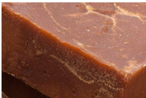
Fig. 3: Panela.

Panela: Según [16] , la panela es un edulcorante natural obtenido a través de la evaporación, concentración y cristalización del jugo de caña de azúcar. En este estudio, como se observa en la figura 3 la panela se emplea como endulzante natural.