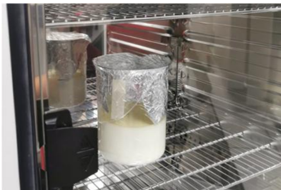
Fig. 2: leche bronca recolectada en el corregimiento de Juan Frio.

Leche bronca: También conocida como leche no pasteurizada o leche cruda, se refiere a aquella leche que no ha sido sometida a ningún proceso posterior al ordeño [15] . Al utilizar esta leche como materia prima principal, garantizando la naturalidad del producto final, como se evidencia en la figura 2.