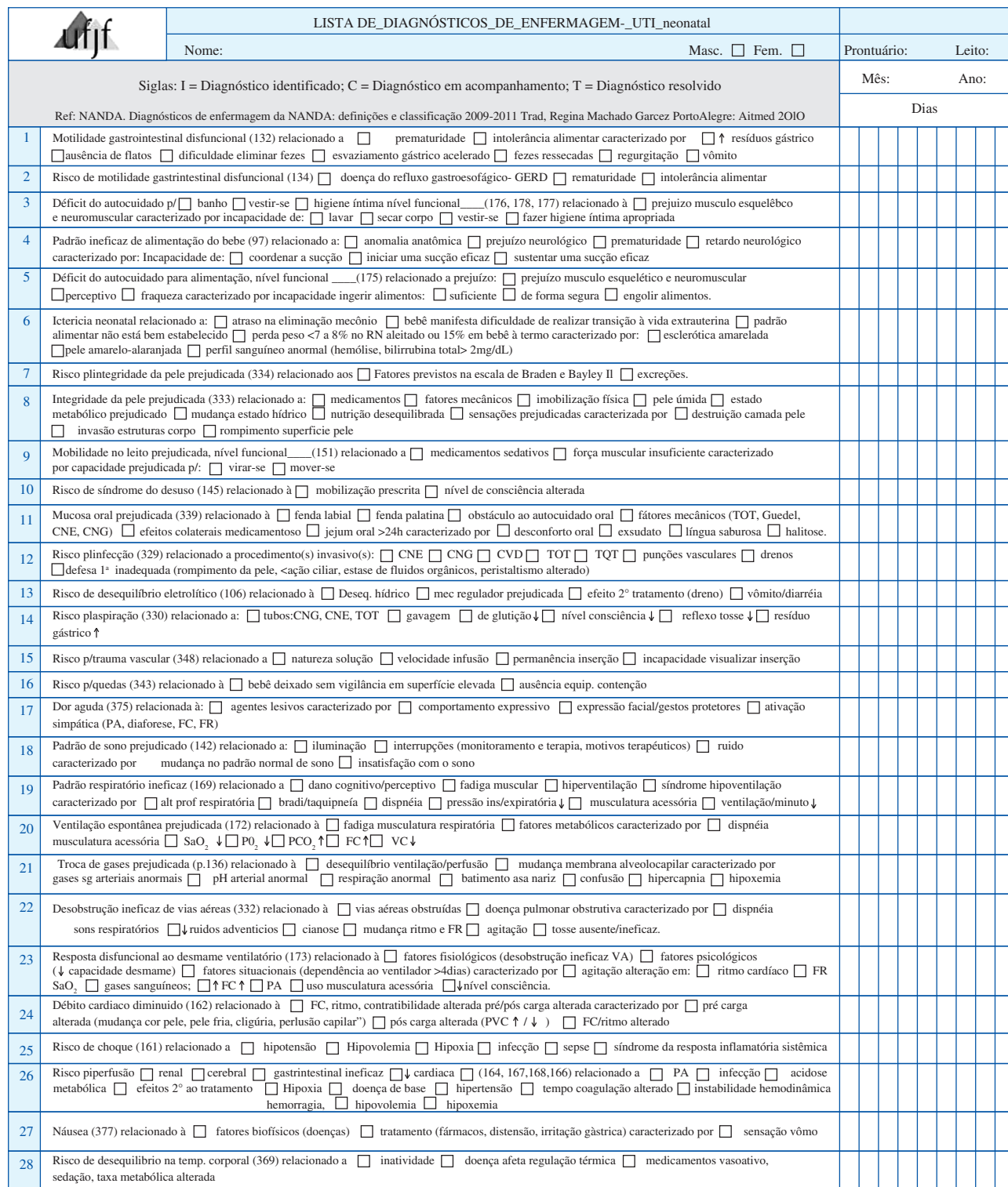
Figura 2 – Lista de Diagnósticos de Enfermagem

Posterior à construção do instrumento de coleta de dados, foi possível estruturar o segundo instrumento, ou seja, possíveis diagnósticos de enfermagem mais incidentes.