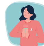
Figura 2. Material educativo reverso "Promoviendo Mi bienestar espiritual"

El amor, la compasión y la generosidad son los soportes esenciales de la paz. La paz interior es una situación de calma y equilibrio que genera en la persona una plenitud.